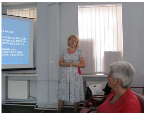
Фото з семінару: