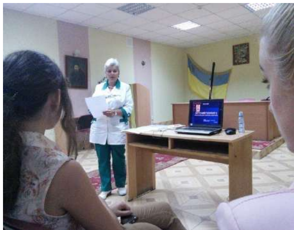
Фото з лекції: